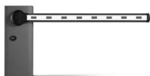
WIL rychlá závara s délkou ramene do 8 m, vhodná pro parking