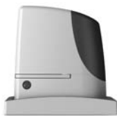
RUN pohon pro posuvné brány do 2500 kg