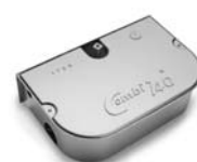
COMBI 740 pohon pro otočné brány do hmotnosti křídla 700 kg