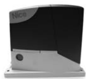
ROAD 400 pohon pro posuvné brány do 400 kg