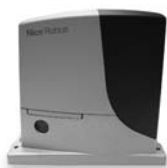
ROBUS pohon pro posuvné brány do 1000 kg