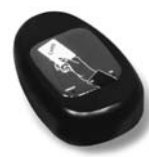
KP 100 snímač bezkontaktních karet s kontrolou vstupů/výstupů