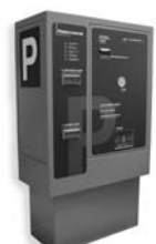
VA 401 platební automat pro výběr parkovného