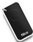
INTI dálkové ovládání s plovoucím kódem, 433.92 MHz