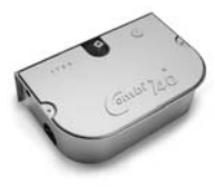
COMBI 740 pohon pro otočné brány do hmotnosti křídla 700 kg