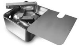
METRO pohon pro otočné brány do velikosti křídla 3,5 m