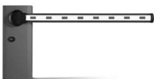
WIL rychlá závora s délkou ramene do 8 m, vhodná pro parking