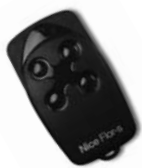
FLOR dálkové ovládání s plovoucím kódem, 433.92 MHz