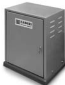
FIBO 400 pohon pro posuvné brány do 4000 kg