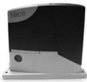
ROAD 400 pohon pro posuvné brány do 400 kg