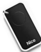
INTI dálkové ovládání s plovoucím kódem, 433.92 MHz