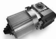
TOM pohon pro průmyslová sekční a rolovací vrata do 750 kg