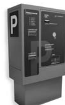
VA 401 platební automat pro výběr parkovného