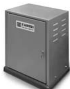
FIBO 400 pohon pro posuvné brány do 4000 kg