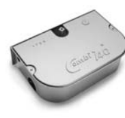
COMBI 740 pohon pro otočné brány do hmotnosti křídla 700 kg