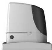
RUN pohon pro posuvné brány do 2500 kg