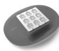
NiceWay dálkové ovládání, 433.92 MHz, provedení zeď, stůl nebo komb.