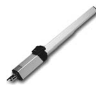
HINDI 880 pohon pro otočné brány do velikosti křídla 6 m