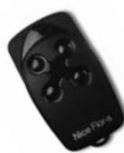
FLOR dálkové ovládání s plovoucím kódem, 433.92 MHz