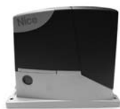
ROAD 400 pohon pro posuvné brány do 400 kg