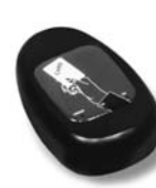
KP 100 snímač bezkontaktních karet s kontrolou vstupů/výstupů