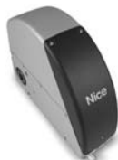
SUMO pohon pro průmyslová sekční vrata do velikosti 35 m 2