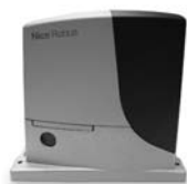
ROBUS pohon pro posuvné brány do 1000 kg