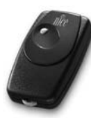
BIO dálkové ovládání, s přesným kódem 40.685 MHz