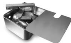
METRO pohon pro otočné brány do velikosti křídla 3,5 m