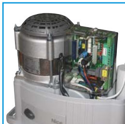
Vestavěná řídicí jednotka v pohonu s větráním

Pohon pro posuvné brány do hmotnosti 1500 kg