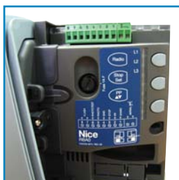
Elektronika pohonu Road 400