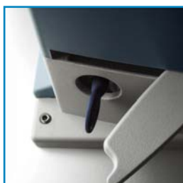
Odblokování pohonu Road 400 pomocí klíče a odblokovací páky

Pohon pro posuvné brány do hmotnosti 400 kg