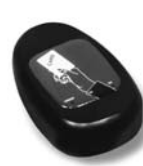
KP 100 snímač bezkontaktních karet s kontrolou vstupů/výstupů