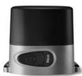
ROBO pohon pro posuvné brány do 600 kg