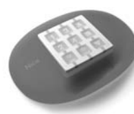
NiceWay dálkové ovládání, 433.92 MHz, provedení zeď, stůl nebo komb.