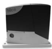
ROAD 400 pohon pro posuvné brány do 400 kg