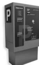
VA 401 platební automat pro výběr parkovného