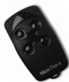
FLOR dálkové ovládání s plovoucím kódem, 433.92 MHz