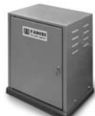
FIBO 400 pohon pro posuvné brány do 4000 kg