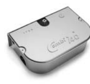
COMBI 740 pohon pro otočné brány do hmotnosti křídla 700 kg