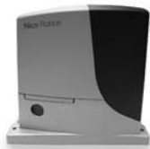
ROBUS pohon pro posuvné brány do 1000 kg