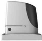
RUN pohon pro posuvné brány do 2500 kg