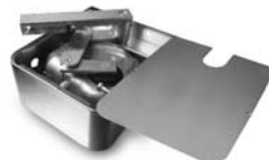
METRO pohon pro otočné brány do velikosti křídla 3,5 m