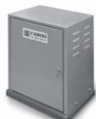
FIBO 400 pohon pro posuvné brány do 4000 kg