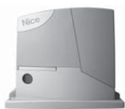
ROAD 400 pohon pro posuvné brány do 400 kg