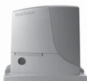
ROBUS pohon pro posuvné brány do 1000 kg