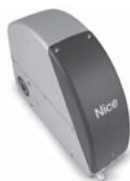
SUMO pohon pro průmyslová sekční vrata do velikosti 35 m 2