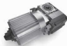
TOM pohon pro průmyslová sekční a rolovací vrata do 750 kg