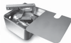
METRO pohon pro otočné brány do velikosti křídla 3,5 m