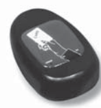
KP 100 snímač bezkontaktních karet s kontrolou vstupů/výstupů