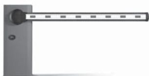
WIL rychlá závora s délkou ramene do 8 m, vhodná pro parking