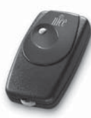
BIO dálkové ovládání, s přesným kódem 40.685 MHz