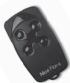
FLOR dálkové ovládání s plovoucím kódem, 433.92 MHz