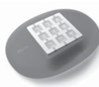
NiceWay dálkové ovládání, 433.92 MHz, provedení zeď, stůl nebo komb.