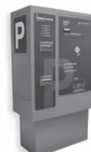
VA 401 platební automat pro výběr parkovného