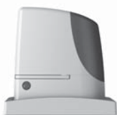
RUN pohon pro posuvné brány do 2500 kg