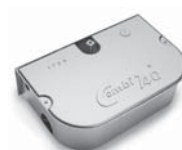
COMBI 740 pohon pro otočné brány do hmotnosti křídla 700 kg